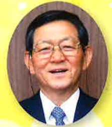
尾家産業株式会社 代表取締役社長